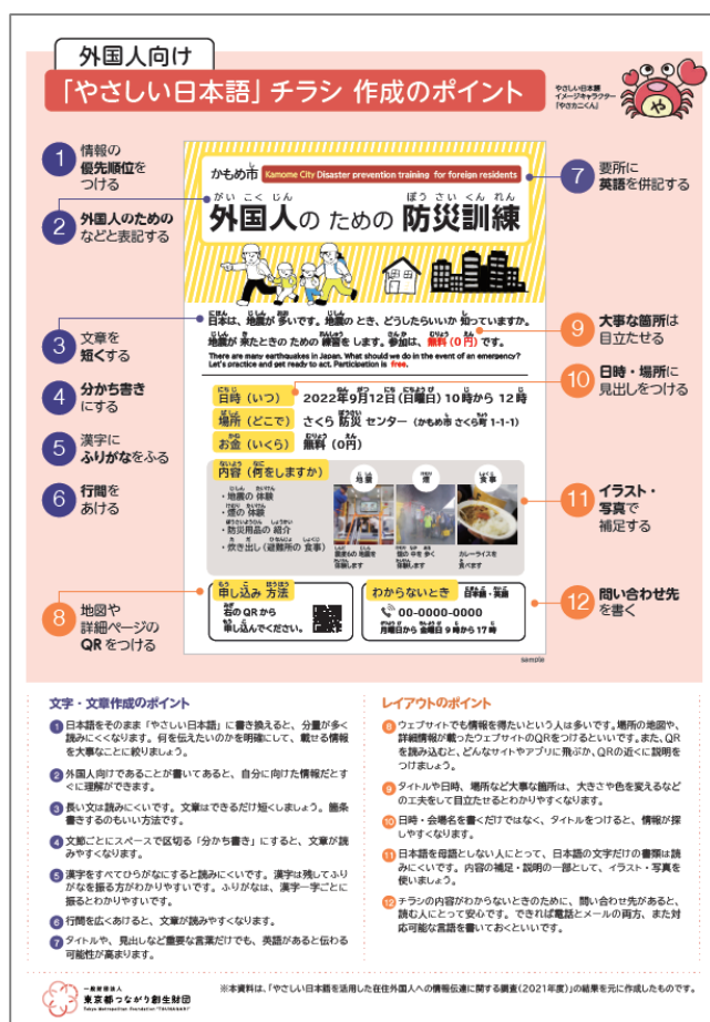
チラシ作成のポイント