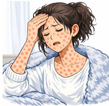
* Ang ilustrasyon na ito ay nilikha gamit ang text generation AI.