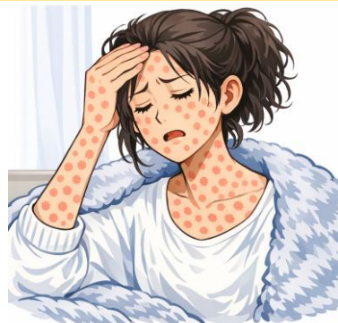
※생성형 AI로 제작한 일러스트입니다.