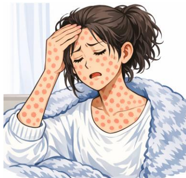
※示意圖由生成式 AI 製成