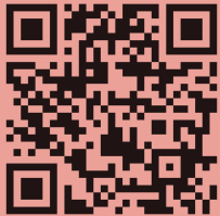
ဖောင်ဒေးရှင်း HP ကြည့်ရန်