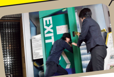
都市型水災体験 都市型水害