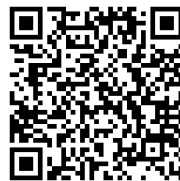
事前申込フォーム

「大久保語」とは、新大久保地区で使われていることばのこと。つまり、日本語の他、ネパール語、ベトナム語、韓国語、中国語などのことです。「言語の先生」として新大久保に住む外国人の方を迎え、日本人と外国人がお互いを良く知るための場づくりです。その第1回目はネパール語を学びます。自己紹介や挨拶、ネパールレストランで注文や感想が言えるようになります。