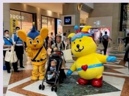
【街頭キャンペーンの様子】